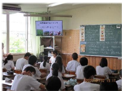
【教科と連携した食育授業】 社会科：3年1組

今年度は、感染対策を徹底した上で、他校の先生方に授業を参観いただき、一緒に学び合う機会を多くもつことができました。