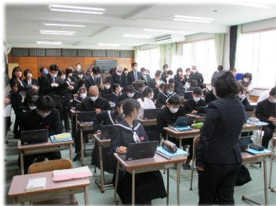
【教育課程研究協議会】 国語：3年4組