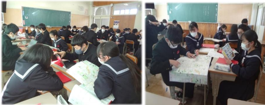
【班別計画を考え合う姿】(まん延防止等重点措置適用前の様子です)

修学旅行に向けての学習が進んでいます。班別計画では、行きたい寺社仏閣を考え合ったり、地図やクロムブックを使って調べたりと、楽しく学ぶ姿があります。見学する順番を考えたり、拝観料や時間を計算したりと大変さはありますが、仲間と知恵を出し合いながら一つひとつ解決していく中に、大きな学びがあります。楽しい修学旅行とするには、やはり、普段の生活が大切であると、学年みんなで確認し合いました。