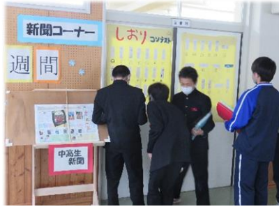
【読書週間 しおりコンテスト】