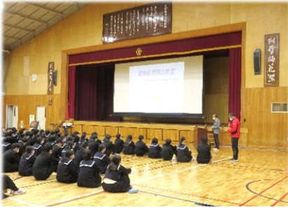
【3年生薬物乱用防止教室】