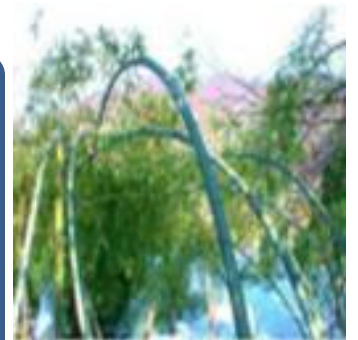
【雪の重みに耐え、折れない竹】

また、「自分を大切にすること。自分を大切にすることと同じように周りの人を大切にすること」についても、自分がどんな特徴をもっていて、人と接する時にどんなことを大切にしているかという視点で、時々振り返ってみてください。