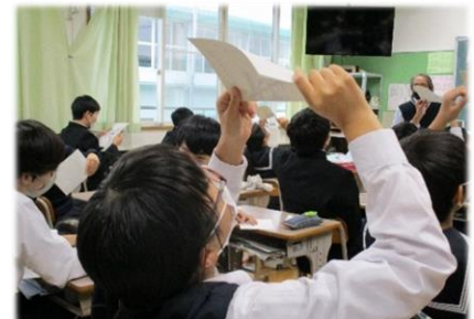
【資料をじっくり眺める生徒】

理科の講座「脳で見る」では、資料を見ながら脳が何を認識するかに熱心に挑んでいる生徒の姿がありました。授業の振り返りの場面では、多くの生徒が「高校の授業に興味がわいてきた」と記していました。