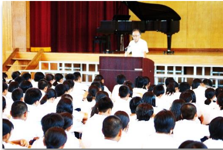
【「二学期、結果を出し花を咲かせよう」】

校長先生からは、「あいさつ・清掃・歌声を大切に、2学期、結果を出していきたい。1年生は、学習や部活など日々の生活を充実させ、2年生は自分の将来を見つめ、目標を立てていきたい。そして3年生は自分の進路選択に向けてしっかり取り組む二学期でありたい」と全校に話がありました。