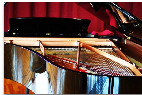
【(株)三ツ和(小諸そば)様よりピアノを寄贈していただきました。ありがとうございます】